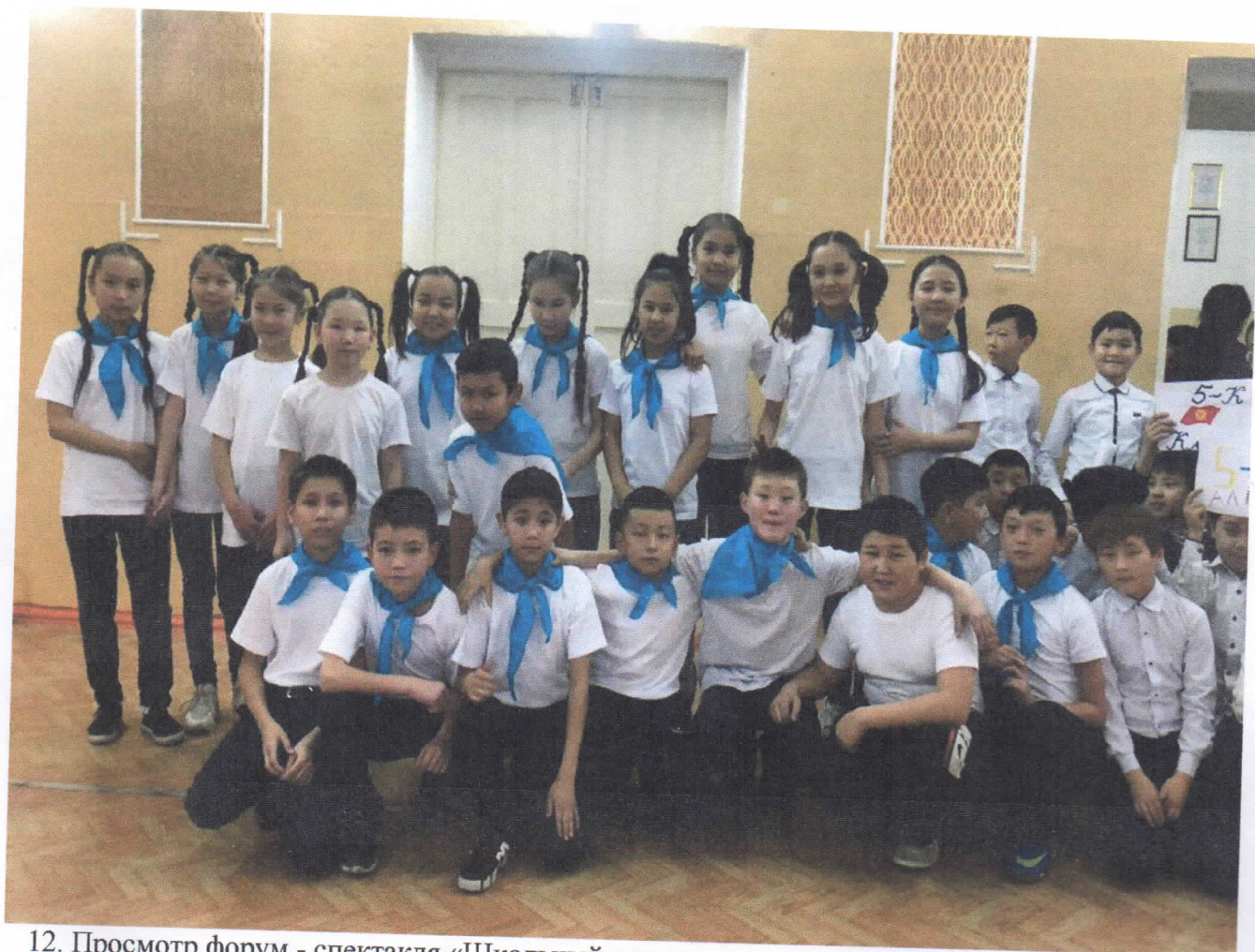
12. Просмотр форум - спектакля «Школьный рэкет»